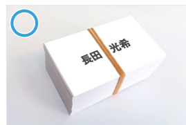
提出者の氏名が記載された紙