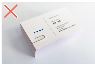
ホチキス、クリップ留めされている