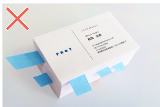
付箋が貼付されている